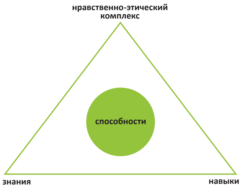
Схема развития компетенций во время подготовки родителей.

При подготовке родителей часто говорят об изучении их мотивации. Мотивация человека, безусловно, связана с удовлетворением его потребностей. Родители с нарушенными, дефицитными потребностями, имеющие зависимое, детское поведение пытаются их бессознательно удовлетворить за счет устроенного в семью ребенка. В процессе подготовки происходит осознание себя, своих намерений и по-